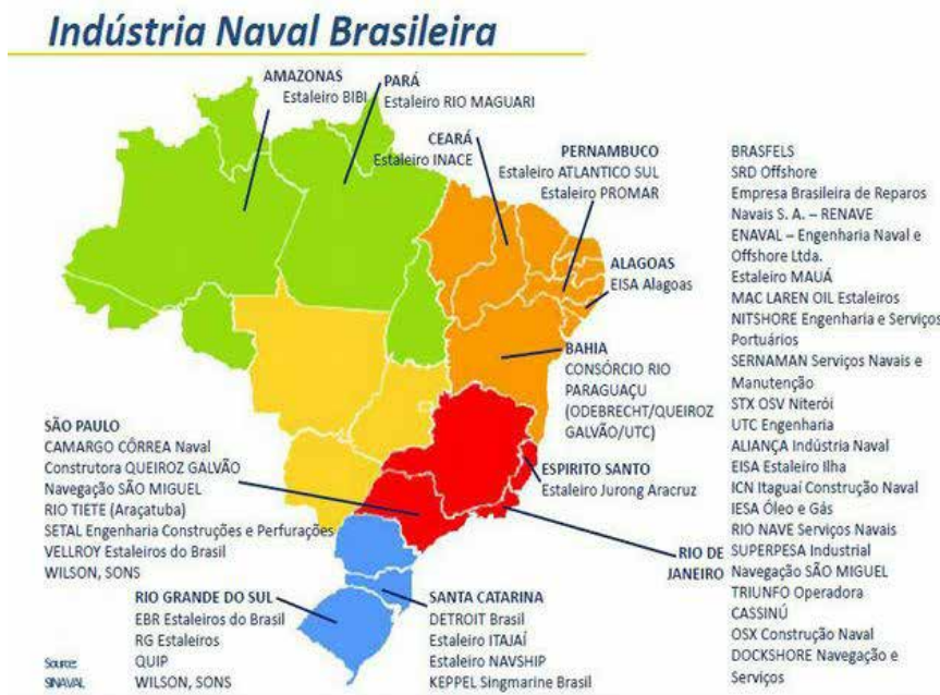
Figura 1 Estaleiros do Brasil