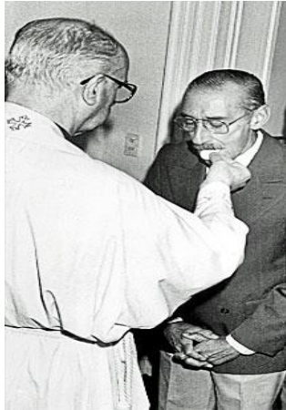
El genocida Videla recibe la comunión