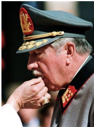
El genocida Pinochet recibe la comunión

Que el tema tiene su lado político, lo confirma la circunstancia que la relación de la dictadura militar iniciada con Videla con la Iglesia, es investigada por la Justicia en la Argentina a los casi 30 años del