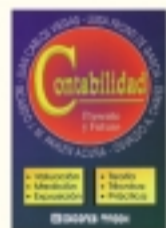
Contabilidad: presente y futuro Oswaldo Chaves y coautores 752 págs. $ 48