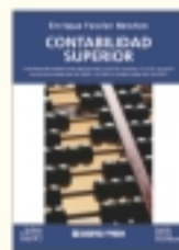
Contabilidad superior Enrique Fowler Nevelon 4ª edición ampl. y act. 1480 págs., 2 tomos. $ 90.