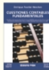
Cuestiones contables fundamentales Enrique Fowler Nevelon 3ª edición ampl. y act. 856 págs. $ 55