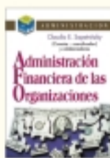
Administración financiera de las organizaciones Claudia Sapentitzky y coautores 632 págs. $ 40