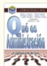
Qué es administración Héctor Larocca y coautores 432 págs. $ 32