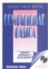
Contabilidad básica Enrique Fowler Nevelon 784 págs. $ 50