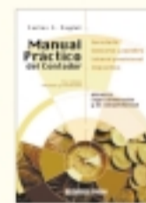
Manual práctico del contador Carlos S. Zaglil 5ª edición ampl. y act. 688 págs. $ 45