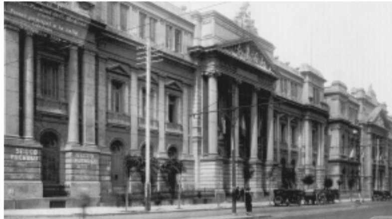
Antigua Facultad de Medicina

Arquitectas - Investigadoras- docentes, Facultad de Arquitectura UBA ilazzari@econ.uba.ar