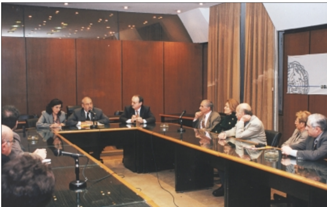
Stiglitz dialogando con el grupo Fénix.