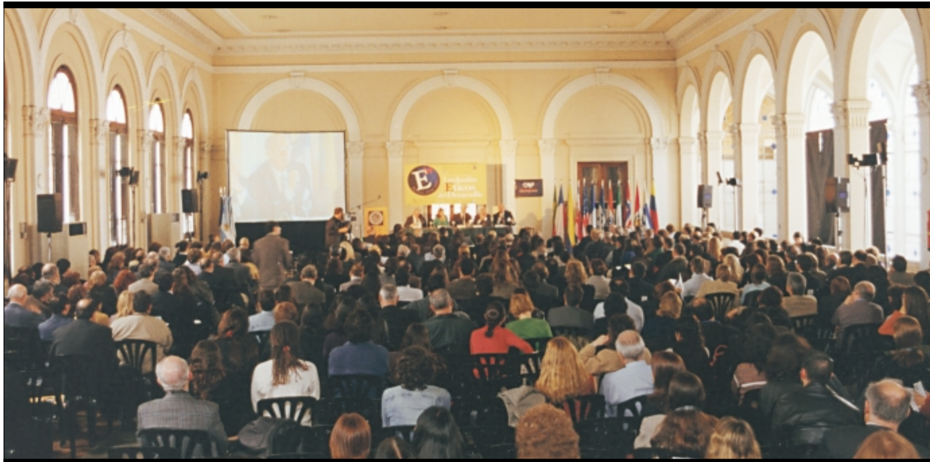
“LOS DESAFIOS ETICOS DEL DESARROLLO”: Inauguración del Seminario Internacional