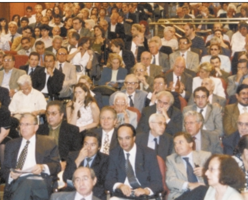
12 de Diciembre: El público y periodistas siguen atentamente la presentación del Plan Fénix

mentar la intermediación bancaria en los pagos y a sostener la captación de ahorros monetarios - en un contexto de adecuado manejo de los encajes fraccionarios y del crédito - acompañará, seguramente, el financiamiento indispensable para la recuperación de la actividad económica, el crecimiento del empleo y la mejoría de los ingresos fiscales.