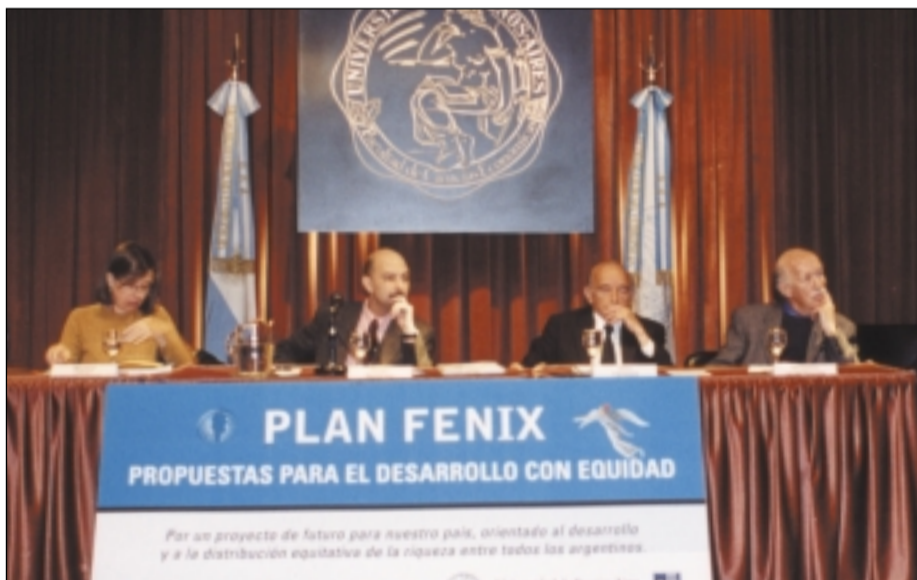
8 DE MAYO: El grupo Fénix analiza el impacto de la guerra contra Irak, en Argentina y A. Latina.