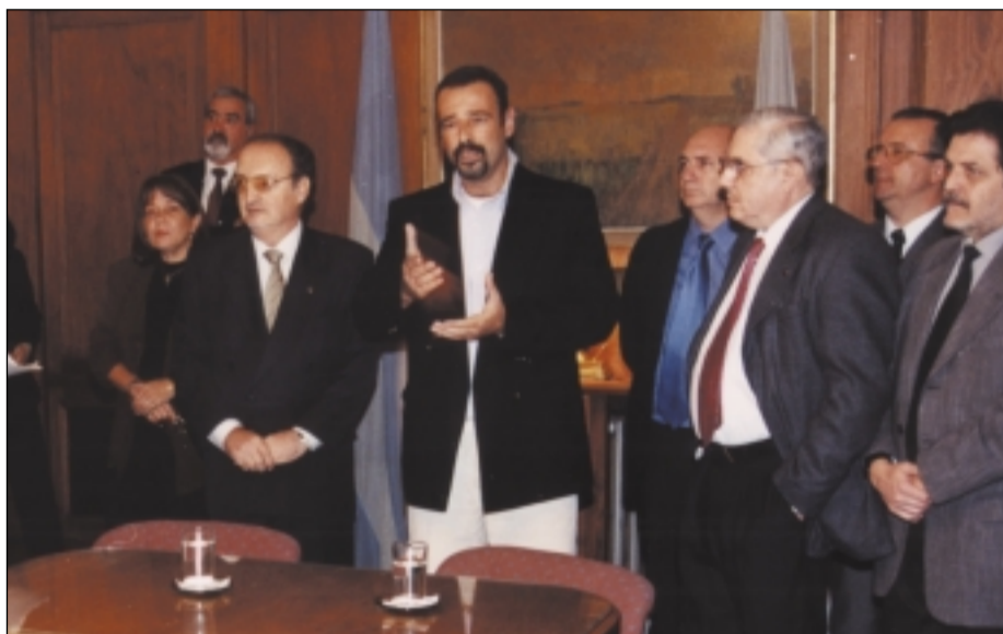
2 DE MAYO: Convenio de cooperación con la Dirección de Rentas del Gobierno de la Ciudad.