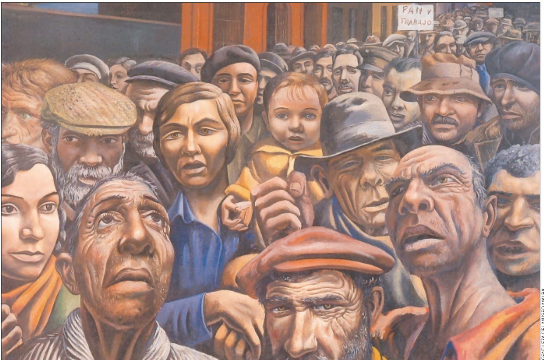
"MANIFESTACION", de Antonio Berni