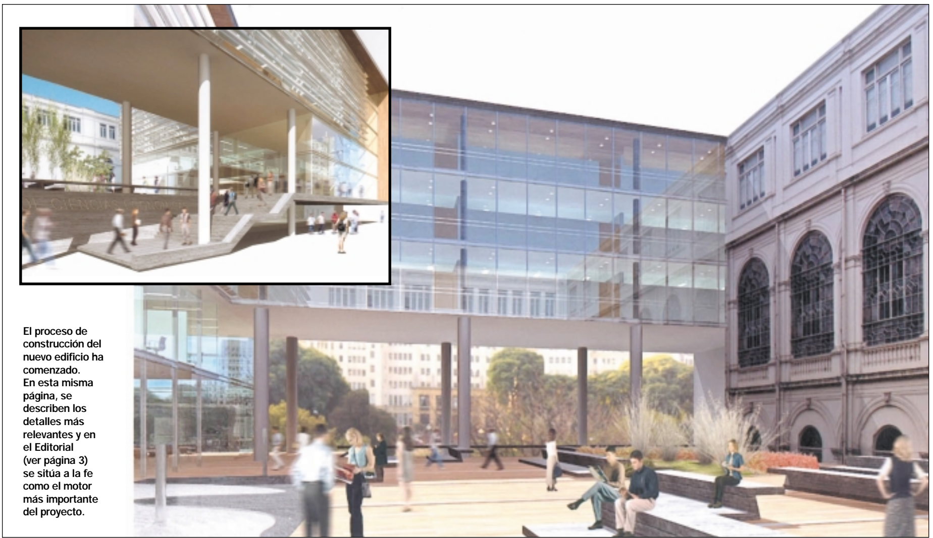
UNA VISION DEL NUEVO EDIFICIO

El proceso de construcción del nuevo edificio ha comenzado. En esta misma página, se describen los detalles más relevantes y en el Editorial (ver página 3) se sitúa a la fe como el motor más importante del proyecto.