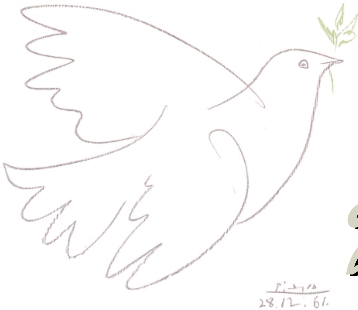
"PALOMA DE LA PAZ", de Pablo Picasso (1961)