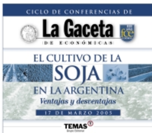
Afiche promocional de la "Conferencia de La Gaceta"

"La sojización", de J. A. Pierri (La Gaceta 53)