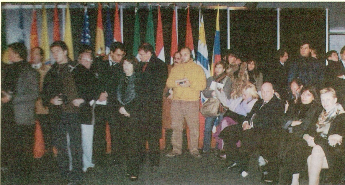
Prensa acreditada y asistentes del congreso ECON 2007.

ECON 2007 representó, sin dudas, el espíritu por el cual fue creado: hacer de Buenos Aires la Capital de las Ciencias Económicas, debatir sobre distintos temas relacionados a las ciencias económicas y poner a la FCE UBA en el centro de los mismos. Fue la primera edición de muchas, una experiencia rica, que trajo inquietudes nuevas que serán debatidas, seguramente, en las ediciones venideras ■