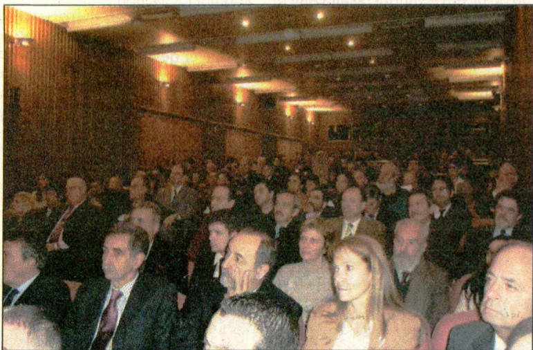
Asistentes a ECON 2007.