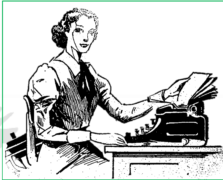
Imagen 1: Nuevo Manual de Dactilografía para máquinas Remington, 1939