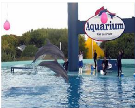
ATRATIVOS NATURALES MAR DEL PLATA

El objetivo de incorporar estos atractivos turísticos es sensibilizar al público objetivo sobre la importancia de preservar el medio ambiente, cuidar y respetar a las especies de flora y fauna, del ecosistema marino.