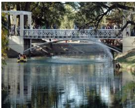
ATRATIVOS NATURALES CORDOBA

Parque Sarmiento: el más grande de la Ciudad de Córdoba y uno de los más grandes de Sudamérica en su interior se encuentra el Museo de Ciencias Naturales y el Jardín Zoológico de Córdoba, así como también el teatro griego y la laguna artificial que posee dos islas, es posible recorrerlo en los botes de alquiler.