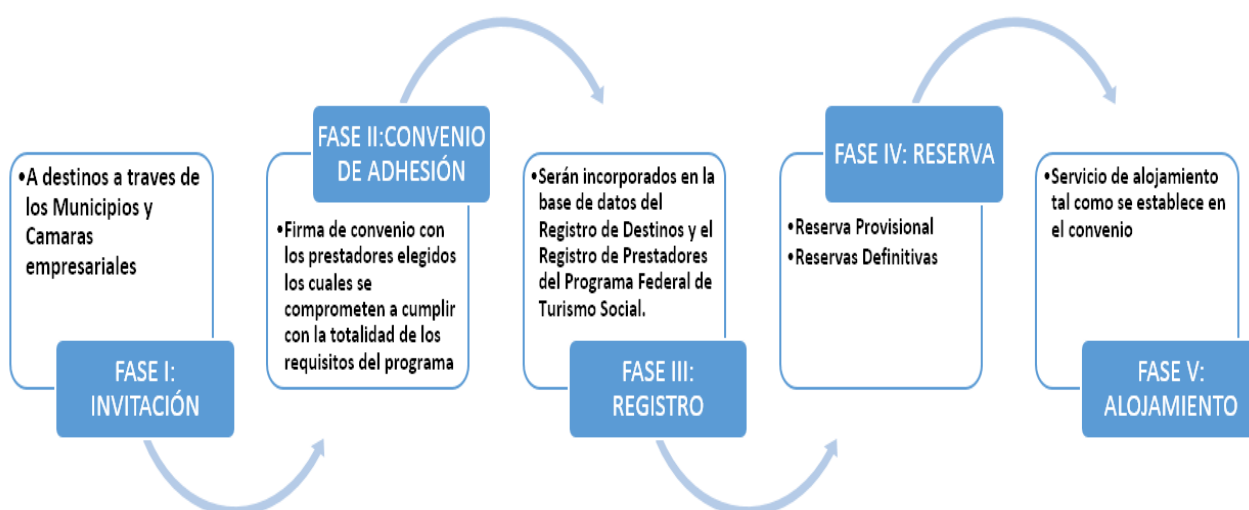
Gráfico N°2 “Fases de implementación Programa Federal de Turismo Social”

Elaboración: Autor