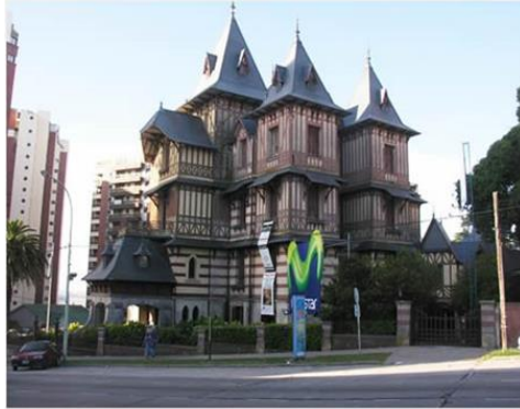
ATRATIVOS CULTURALES MAR DEL PLATA

Villas y residencias: de estilo pintoresquista con rasgos de corriente francesa, italiana, normanda y neocolonial.