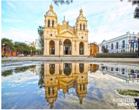
ATRATIVOS CULTURALES CORDOBA

Museo Superior de Bellas Artes Evita: exhibe, como muestra permanente, una selección de diferentes obras, que constituyen el acervo patrimonial del Gobierno de la Provincia de Córdoba, en la que se puede observar pinturas de artistas