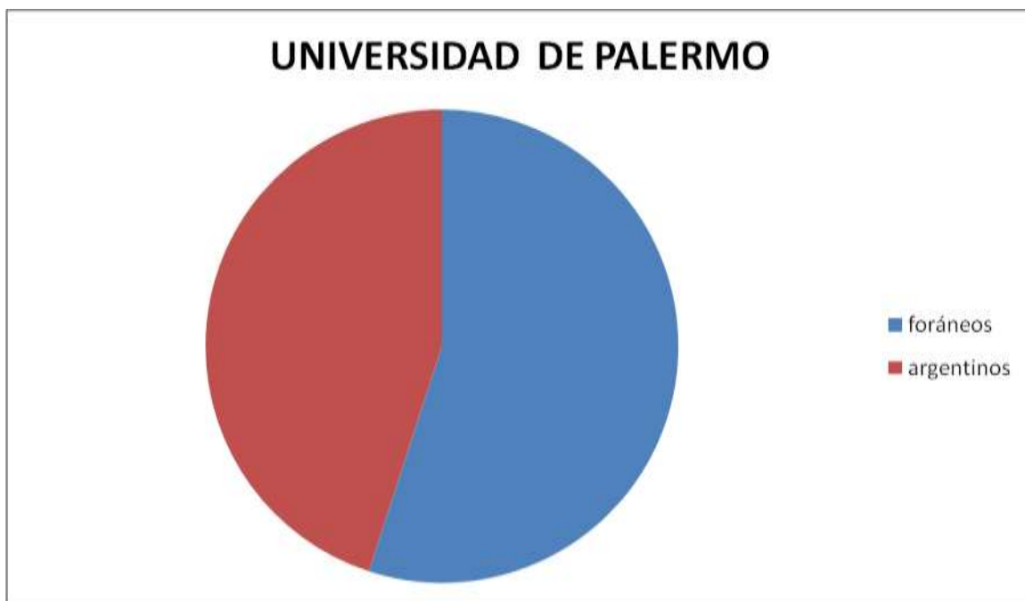
Cuadro alumnos extranjeros y argentinos

Los resultados son: 1 de cada 4 estudiantes extranjeros está rodeado en su diario vivir por la mayoría de argentinos, mientras que los otros 3 comparten su vivienda con estudiantes también extranjeros; esta es una clara prueba de qué tan importante es el hecho de que los actos culturales y sociales de los distintos países fueran incluidos en este trabajo, en México al no tener masas tan grandes en la misma zona (recordemos que no se concentran en una sola región como acá), no se ve tan marcada la distinción entre los compañeros, puesto que prima la población mexicana por sobre las demás, en cualquier ambiente. Por su parte, en España se nota una similitud a la de Buenos Aires también en su capital, de esta forma se crean grandes espacios poblados por comunidades (hispanas en su mayoría) que se unen usualmente en torno al comercio y luego van creando una especie de barrio con diferencias culturales bien marcadas dependiendo de la zona donde se ubiquen.