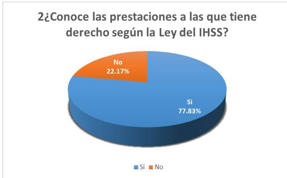
Figura 2 Prestaciones por Derecho