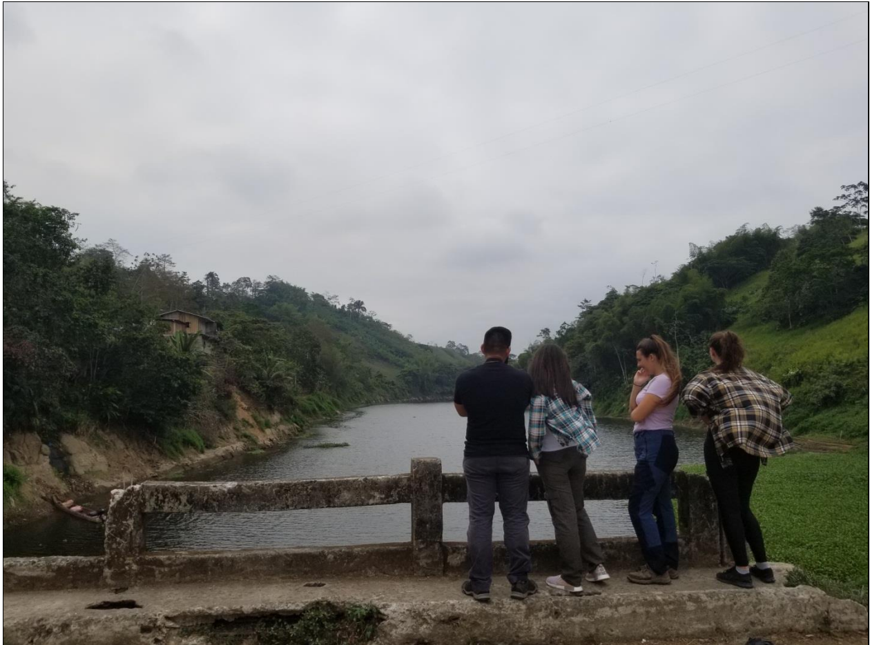
Puente de ingreso al sector de Río de Oro.