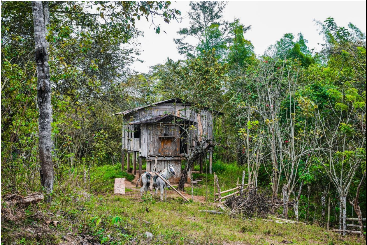
Una casa ne las cercanías del poblado abandonado de Río de Oro.