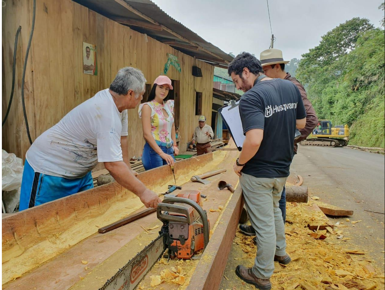
Artesano local mientras elabora una canoa en las cercanías del puente de ingreso al sector.