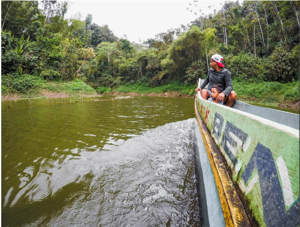
Una parada en el recorrido para observar la especies de flora y fauna.