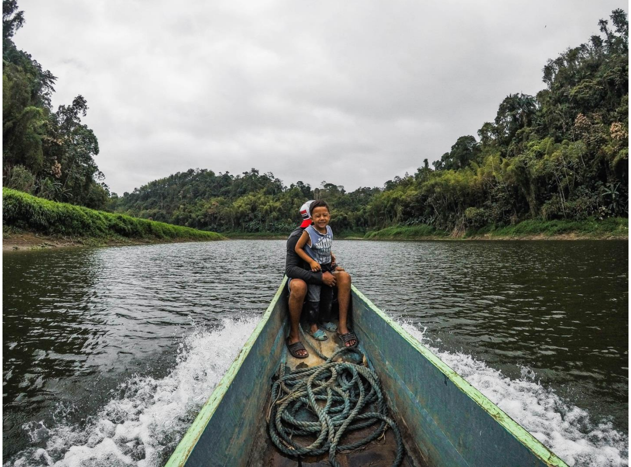
Habitantes locales durante un recorrido por el río.